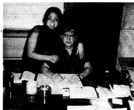
Carmelo Bene in una foto del 1996 con Luisa Viglietti

«Questi quattro giorni - spiega Liberovici - propongono una riflessione sulle nuove tecnologie, l'assaggio di un teatro nuovo che utilizza strumenti scientifici e attuali, declinando la rappresentazione agli aspetti della modernità».