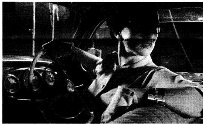
Madre Assassina, un'immagine del video del Teatrino Clandestino

«Questi quattro giorni - spiega Liberovici - propongono una riflessione sulle nuove tecnologie, l'assaggio di un teatro nuovo che utilizza strumenti scientifici e attuali, declinando la rappresentazione agli aspetti della modernità».